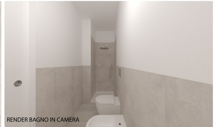
RENDER BAGNO IN CAMERA